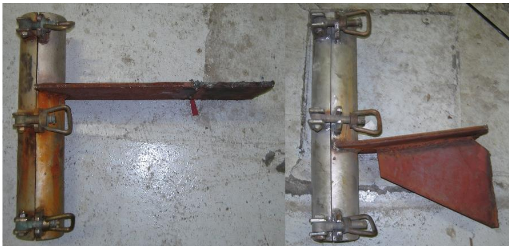
Kareletik askatzen den besarkagailua